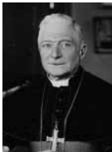
Kardinal Achille Liénart

Dei Verbum ist der vielleicht am heftigsten diskutierte Konzilstext und besitzt als solcher eine spannende und komplexe Vorgeschichte, die an dieser Stelle nur in