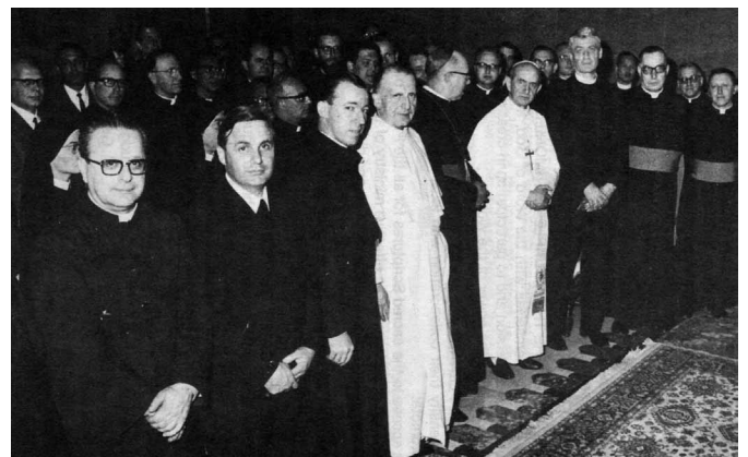
Bei der konstituierenden Versammlung der WCFBA (jetzt KBF); in der Mitte Papst Paul VI. und Kardinal Willebrands

Weitere wegweisende Veröffentlichungen des Lehramtes zur Frage der Interpretation der Bibel in der Kirche seien an dieser Stelle nur genannt: So das evangelische Schreiben Evangelii Nuntiandi von Papst Paul VI. „über die Evangelisierung in der Welt von heute“ (1975) und ein weiteres Dokument der Päpstlichen Bibelkommission aus dem Jahre 2001, das sich mit der Bedeutung des Alten Testaments für Juden und für Christen beschäftigt („Das jüdische Volk und seine Heilige Schrift in der Christlichen Bibel“). Auch diese Dokumente sind im weiteren Kontext der Rezeption von Dei Verbum zu sehen.