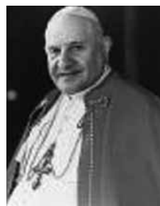
Papst Johannes XXIII.

Noch während des Konzils, zwischen der dritten und vierten Tagungsperiode, erscheint am 21. April 1964 eine Instruktion der Päpstlichen Bibelkommission mit dem Titel De historica evangeliorum veritate („Über die historische Wahrheit der Evangelien“). Im Gegensatz zum Monitum von 1961 betont dieses Dokument den