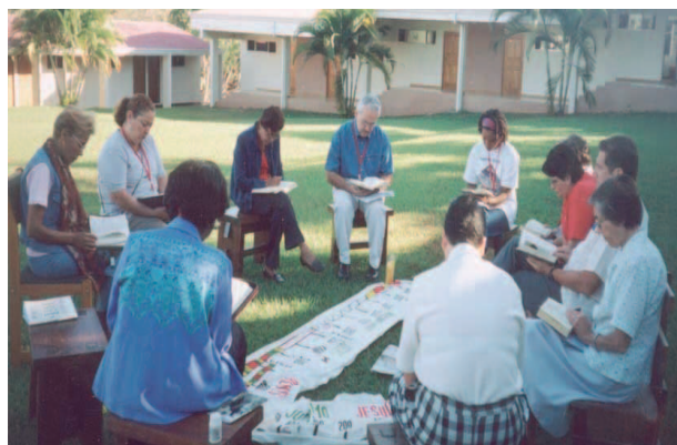
Compartiendo la Biblia: la lectura en común de la Biblia a la luz de la propia vida

esta celebración de oración bíblica. El texto elegido fue la parábola del samaritano, que nos invita a concretizar la misericordia. Ubicados en primera fila, como invitados de honor, estaban los grupos de hermanos sordos, enfermos viviendo con síndrome de SIDA, pacientes de cáncer y madres solteras: humilde signo de humanidad caída a lo largo de los caminos de hoy, que va recibiendo de la Palabra la fuerza para levantarse y vivir. Ellos nos entregaron las rosas que intercambiamos en el saludo o augurio final: «La paz sea contigo. ¡Seamos prójimo de nuestros hermanos!».