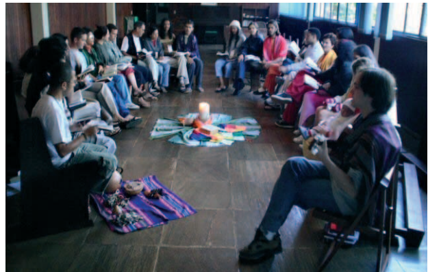
Círculo bíblico en una de las escuelas bíblicas del CEBI (Brasil)

Las actividades del CEBI tienen lugar sobre todo en el contexto de grupos pequeños y en las llamadas escuelas bíblicas, que existen en casi todos los estados del Brasil. Estos grupos se reúnen con cierta regularidad para estudiar la Biblia, para enfrentar las realidades de la vida diaria, para estar y celebrar juntos. De esa manera, se apoyan en su fe y en su experiencia. Muchos de los participantes escriben sus reflexiones y las comparten como material de estudio para muchos otros grupos. Para sostener estas iniciativas, el CEBI tiene un programa de publicaciones, realizado en sus propias imprentas, que le permite asegurarse de que el material llegue a la gente en un lenguaje accesible y a precios abordables.