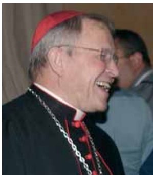
Kardinal Walter Kasper

unterschiedlicher Weise, je ihren Part haben: das Zeugnis des kirchlichen Amtes wie das Zeugnis der Laien und der Theologen, das Zeugnis der Heiligen wie des einfachen Volkes, nicht zuletzt das Zeugnis der Liturgie, aber auch das der kirchlichen Kunst und der Fremdprophetie der Welt.