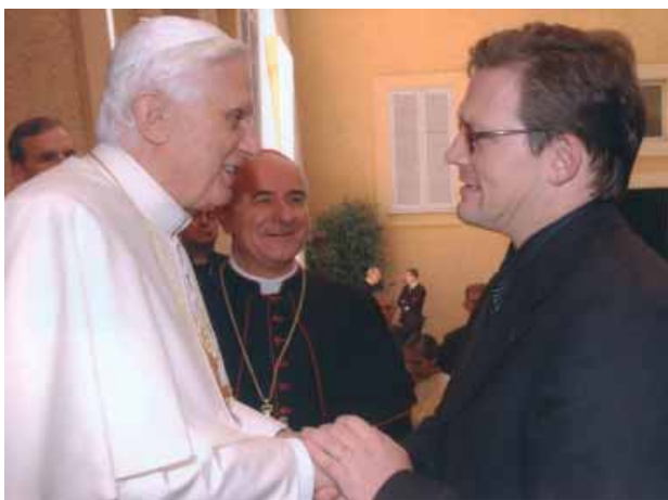
Generalsekretär Schweitzer im Gespräch mit dem Papst

Ich beglückwünsche euch zu dieser Veranstaltung, die an eines der wichtigsten Dokumente des Zweiten Vatikanischen Konzils anknüpft. Ich bedanke mich von ganzem Herzen bei all denen, die im Dienste der Übersetzung und Verbreitung der Bibel tätig sind und die Hilfsmittel bereitstellen, um die Botschaft zu erläutern, zu lehren und zu interpretieren. In diesem Sinn gilt mein ganz besonderer Dank der Katholischen Bibelföderation für ihre Aktivitäten, für die von ihr geförderte Bibelpastoral, für die Treue zu den Weisungen des Lehramtes und für den Geist der Offenheit für die ökumenische Zusammenarbeit im biblischen Bereich.