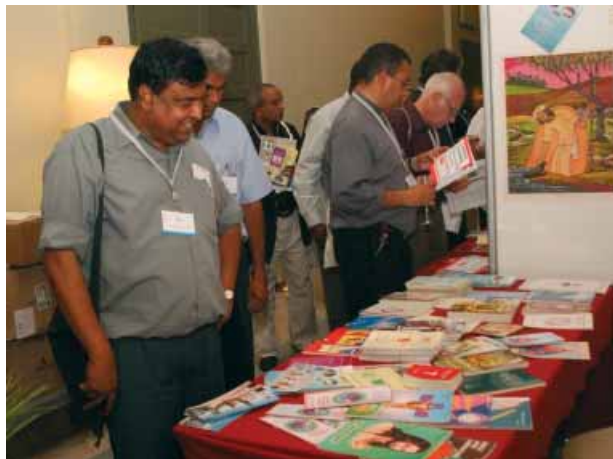
Die Bibelausstellung im Foyer des Tagungszentrums

im Leben der Kirche geführt, namentlich in der Predigt, in der Katechese, in der Theologie, in der Spiritualität und auch auf dem Weg der Ökumene. Die Kirche muss sich immer wieder erneuern und verjüngen, und das Wort Gottes, das nicht altert und nie versiegt, ist dazu das beste Mittel. Denn das Wort Gottes ist es, das, durch die Vermittlung des Heiligen Geistes, immer wieder in die ganze Wahrheit führen wird (vgl. Joh 16,13).