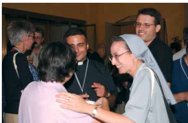
Gespräche und Begegnungen während der Pausen

Wenn das Wort Gottes, seine Mitteilung, Gottes Kommunikation mit der Menschheit ist, dann muss die Kirche unbedingt uneingeschränkter Gebrauch von den modernen Kommunikationsmitteln machen. Der Kommunikations-„Highway“ ist derzeit zur Gänze von weltlichen Botschaften besetzt. Das Wort Gottes muss auch auf diesem Informationshighway präsent werden, auf dass die Welt glaube. Es hat den Anschein, dass es der modernen Informationstechnologie gelingt, die Kluft zwischen Arm und Reich zu überbrücken. Es ist heute selbst im ärmsten afrikanischen Dorf möglich, nur mit Hilfe der Sonnenenergie und der Satellitentechnik ein Computernetzwerk mit Internetanschluss zu errichten. Vor 20 Jahren wäre das noch nicht gegangen, und schon gar nicht im Jahre 1965. Wir können also mit Hilfe moderner Technologie neue Betätigungsfelder eröffnen und mehr Menschen ansprechen.