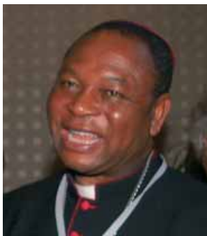
Erzbischof John Onaiyekan

Die Bibel ist heute eindeutig das Buch der Kirche. Es gab aber Zeiten, in denen es den Anschein hatte, dass man die Katholiken von ihrer Lektüre abschrecken wollte. Die Bibel bei sich zu tragen, galt als „typisch protestantisch“. Der Katholik ging mit Rosenkranz und Gebetbuch zur Kirche. Er bezog seinen Glauben aus dem Katechismus und den berühmten biblischen Geschichtsbüchern. Der Protestant oder die Protestantin trug die Bibel und vielleicht auch ein Gesangsbuch zur Kirche und zur Sonntagsschule. Aber seit Dei Verbum hat sich in dieser Hinsicht sehr viel geändert.