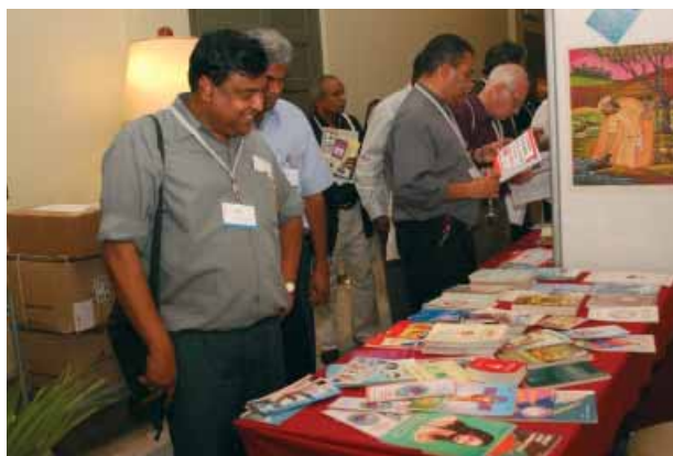
L'exposition biblique qui a accompagnée le congrès

Nous rendons grâce au Seigneur pour la reconnaissance actuelle de l'importance fondamentale de la Parole de Dieu ; une reconnaissance due, entre autres, à l'impulsion donnée par la Constitution dogmatique Dei Verbum . D'où un renouveau dans la vie de l'Église, tout particulièrement dans les domaines de la prédication, de la catéchèse, de la théologie, de la spiritualité et de l'œcuménisme. L'Église devrait toujours se renouveler et se régénérer ; or la Parole de Dieu, qui ne vieillit et ne s'épuise jamais, est un moyen privilégié pour atteindre ce but. Et, de fait, c'est la Parole de Dieu qui, par l'Esprit, ne cesse de nous conduire vers la vérité tout entière (cf. Jn 16,13).