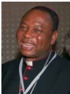
El arzobispo Onaiyekan

En gran medida, la Biblia se ha convertido en el libro de la Iglesia. Hubo un tiempo en que parecía que se disuadía a los católicos de que leyeran la Biblia. Por lo menos, según mi experiencia de niño en Nigeria, de alguna manera, era verdaderamente así. Hasta se consideraba que manejar una Biblia era típico de los protestantes. Los