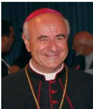
El obispo Vincenzo Paglia

Han pasado exactamente 40 años de la emanación de la Constitución Dei Verbum . Con este título el Concilio Vaticano II ha resaltado la primacía de la Palabra de Dios y ha re-entregado, si se me permite la expresión, la Biblia a todos los fieles.