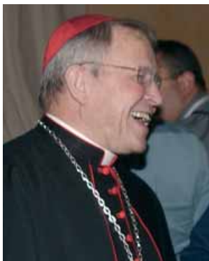
El cardenal Walter Kasper

solamente con la participación de todos, cuando cada uno desempeña el propio papel, de modo distinto y diferente de los demás: se trata del testimonio del Magisterio, de los laicos, de los teólogos, de los santos y de la gente común, así como de la liturgia, del arte sacro y de la profecía en el mundo.