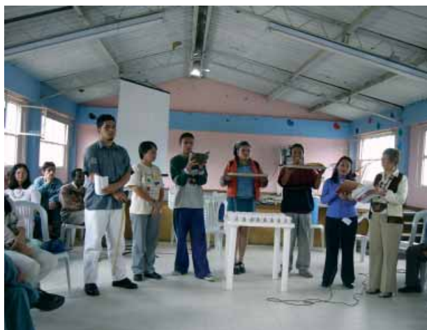
Während einer ökumenischen Bibelwoche in Bogotá

Das Medium für diese Arbeit ist die Bibel. Im Zentrum der Arbeit von CEDEBI steht die so genannte lectura popular , eine lebensbezogene, an der gesellschaftlichen Realität orientierte Art des Bibellesens und -teilens. Sie sieht in den biblischen Texten keine Geschichten aus der Vergangenheit, sondern Überlieferungen, die eine lebendige, aktuelle und lebensverändernde Kraft in sich tragen.