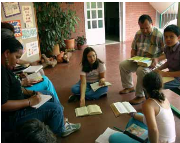
CEDEBI-Mitglieder bei der lectura popular

Eine dieser Bewegungen ist CEDEBI ( Colectivo Ecuménico de Biblistas ), eine ökumenische Vereinigung lateinamerikanischer Bibelwissenschaftlerinnen und Bibelwissenschaftler, die seit ihrer Gründung 1992 auf dem Gebiet der Bibelarbeit tätig ist und sich dabei besonders im Bereich der Frauen- und Familienarbeit engagiert. Die Vision, an deren Verwirklichung CEDEBI mitwirkt, ist eine Gesellschaft, in der Geschlechtszugehörigkeit kein Grund für Benachteiligung und Armut mehr sind.