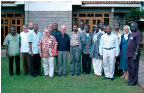
Gute Beziehungen fördern den Dialog - Teilnehmer eines Treffens für Bibelkoordinatoren

voneinander. Der Dialog verstärkt die guten Beziehungen und schafft Vertrauen. Ein echter Dialog kann nur in einer Atmosphäre der Offenheit stattfinden. Offenheit ermöglicht es uns, dem anderen zuzuhören, in der Hoffnung, dass auch der andere uns zuhört. So wie wir den anderen verstehen lernen, so hoffen wir, dass auch der andere uns verstehen lernt: Offenheit beruht deshalb stets auf Gegenseitigkeit.