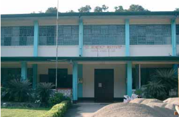
Le Saint Benedict Institute où vivent 84 jeunes, femmes et hommes

Politiquement parlant, les Philippines se sont engagées sur le chemin de la démocratie depuis la fin du régime Marcos ; économiquement toutefois, le pays est confronté à autant de problèmes qu'avant. Près de 35% de la population, qui en compte 80 millions, vit sous le seuil de pauvreté. Quant à la religion, les Philippines – à l'exception du Timor oriental - sont le seul pays chrétien d'Asie ; 83% de la population appartenant à l'Église catholique.