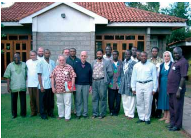
De bonnes relations favorisent le dialogue - Participants à une rencontre d'animateurs bibliques

peuples. Quand celles-ci peuvent communiquer, elles apprennent à mieux se connaître et mieux se comprendre. Le dialogue renforce les bonnes relations et construit la confiance. Le dialogue prend place dans une atmosphère d'ouverture. Savoir écouter l'autre – et oser espérer que l'autre va nous écouter – n'est possible que par l'ouverture d'esprit. Nous nous éclairons mutuellement. L'ouverture doit donc être réciproque.