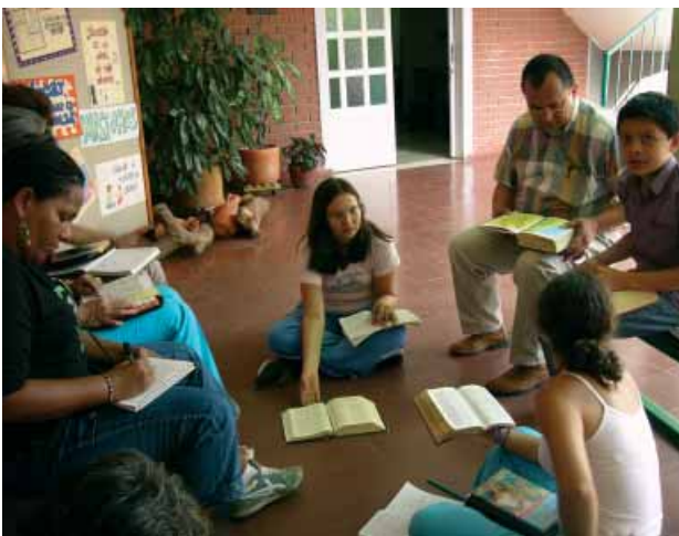
Des membres du CEDEBI, en train de pratiquer la lectura popular

L'un de ces mouvements est le CEDEBI ( Colectivo Ecueménico de Biblistas ), une association œcuménique de biblistes sud-américains, femmes et hommes, fondée en 1982. Il s'est montré très actif dans le domaine du travail biblique, tout particulièrement en direction des femmes et des familles. Le CEDEBI s'est attaché à promouvoir une vision de la société, dans laquelle la différence sexuelle ne constitue plus un facteur de discrimination ni de pauvreté.