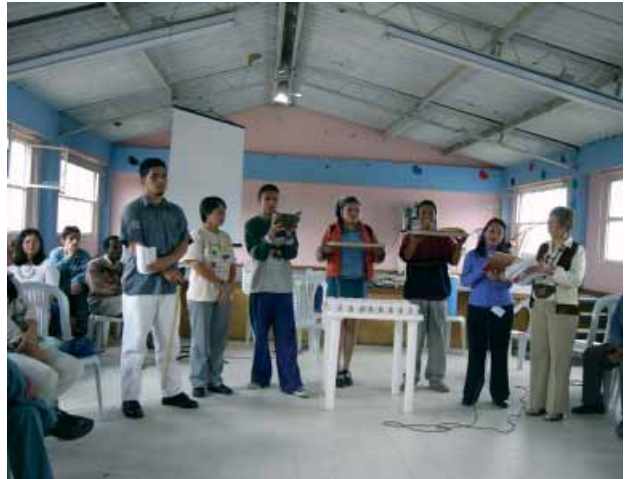
La Semaine biblique œcuménique à Bogotá

toire concernant le passé qu'un ensemble de traditions porteuses d'une puissance de vie, de sens et de transformation. L'objectif des membres du CEDEBI est de faire entrer la Bible en dialogue avec la vie quotidienne de ses lecteurs. Ce travail vise à renforcer la conscience de soi et l'autonomie des femmes, des hommes et des enfants, pour qu'ils soient capables de s'autodéterminer et d'être pleinement responsables de leur vie.